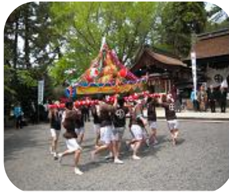
社頭で威勢よく奉納

長良川で禊ぎをした舟神輿が三艘、大祭を盛り上げます。この外にもさまざまな神輿や芸能が奉納されます。