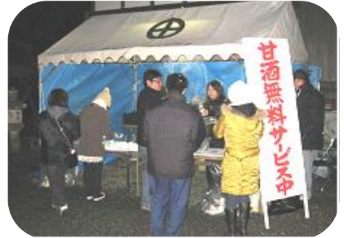
サービスを受ける人々