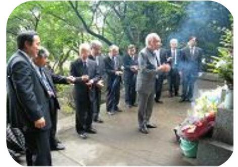
城山の薩摩義士碑参拝