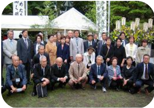
海津市からの参拝団の皆さん