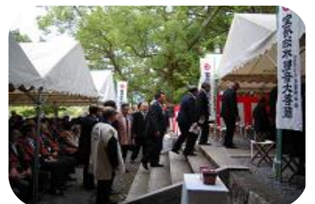
宝暦治水観音堂の光景