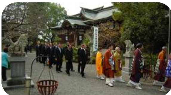
治水神社社頭を出発