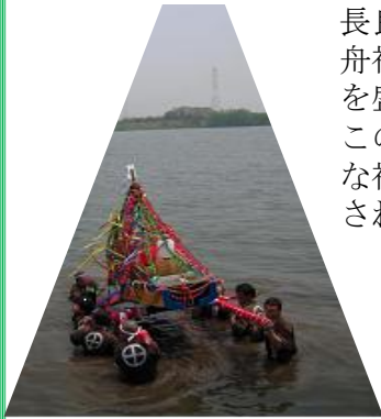
長良川でのみそぎ